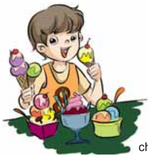
chī hěn duō bīng qí lín 吃很多冰淇淋