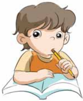
yǎo qiān bǐ 咬铅笔

shuōshuo nǎ xiē shì hǎo xí guàn nǎ xiē shì huài xí guàn 说说哪些是好习惯，哪些是坏习惯？