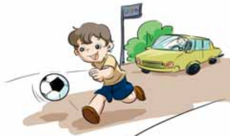
zài mǎ lù zhōngjiān tí qiú 在马路中间踢球