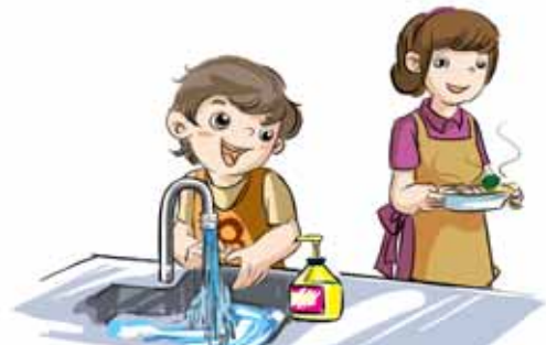
chī fàn qián xǐ shǒu 吃饭前洗手