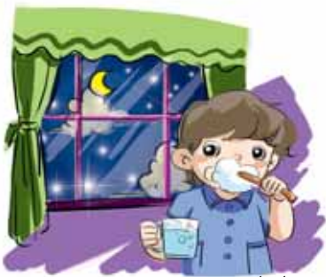
shuì jiào qiánshuā yá 睡觉前刷牙