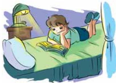
zài hūn àn de guāngxiàn xià kàn shū 在昏暗的光线下看书