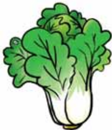
xiǎo bái tù de bái cài 小白兔的白菜

chù bù yí yàng nǐ néngzhǎo chū lái ma 处不一样，你能找出来吗？