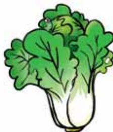
xiǎo huī tù de bái cài 小灰兔的白菜