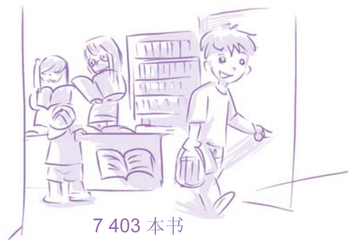
7 403 本书